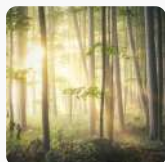
Protection des forêts