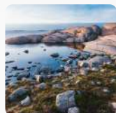
Protection des littoraux